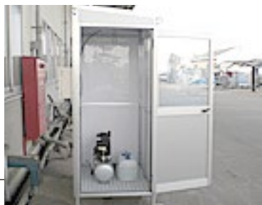
簡易キット型 (押しボタン)