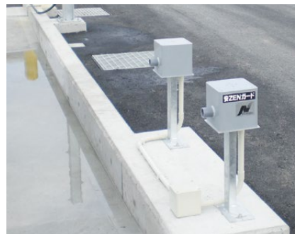
ダブルセンサ感知型

スイッチボックスの“ON”で洗浄ガンへ給水します。洗浄ガン使用中に車輻を感知した場合は、ゲートへの給水を優先し、洗浄なしでの車輻の通り抜けを防ぎます。